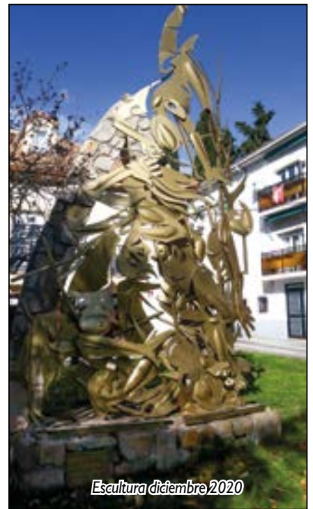
Escultura diciembre 2020

Esta escultura, que trata de representar de forma alegórica el mundo (nuestro planeta) en todas sus variantes materiales con la esperan-