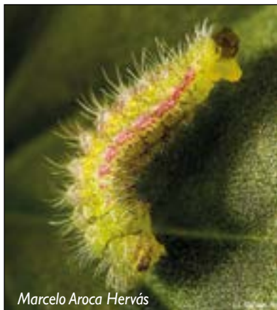
Marcelo Aroca Hervás

se puede detectar su presencia por los pequeños agujeros que son visibles en los tallos y si el ataque se ha producido recientemente además se ven pequeños montículos de restos vegetales al minar el interior del tallo y otras partes de la planta y dejar lo que podríamos decir coloquialmente como los escombros. La oruga continúa penetrando en los tejidos blandos interiores del tallo donde los va digiriendo y dejando sus restos de excremento negros