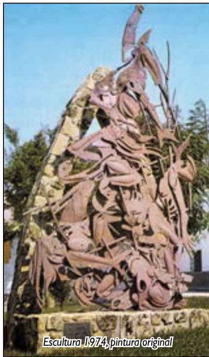
Escultura 1974, pintura original

Creo que no hace falta explicar, ya que cualquier persona un poco sensible y razonablemente ilustrada sabe que hay que respetar las obras artísticas tal y como las creo su au-