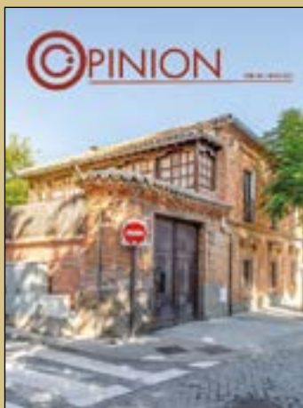
Fotografía de portada: "Casa del cura" Septiembre 2019 Ana Martín Padellano