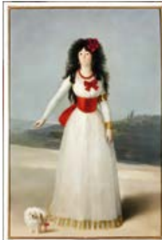
Retrato de la XIII duquesa de Alba realizado por Francisco de Goya

La esposa de Carlos IV, María Luisa de Parma había adquirido según la moda del momento, un precioso vestido exclusivo en París; enterada la XIII duquesa de Alba, María del Pilar Teresa Cayetana de Silva Álvarez de