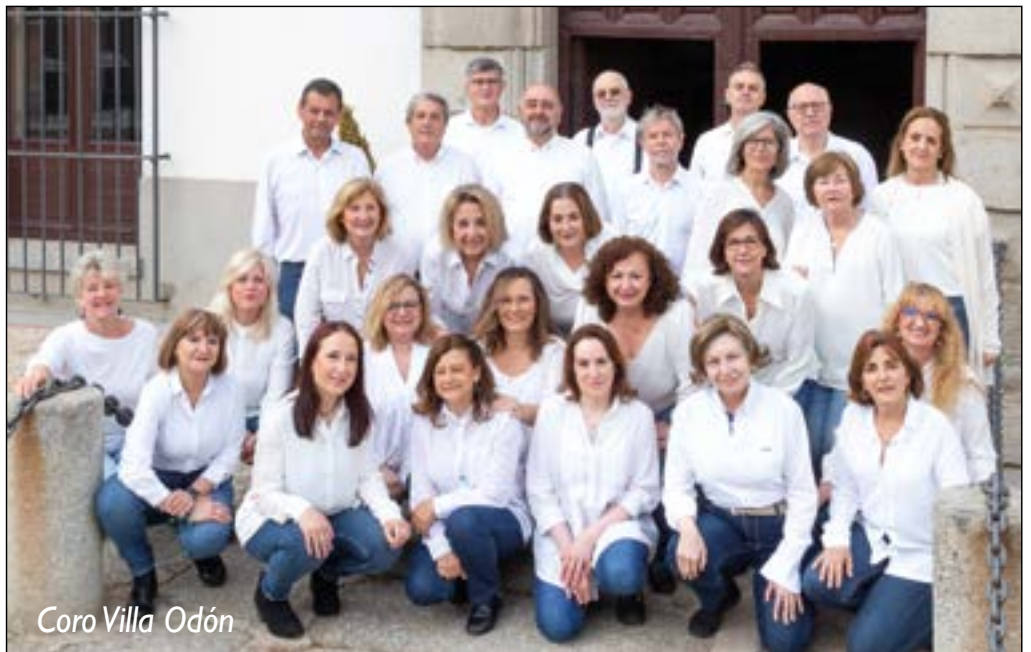
Coro Villa Odón