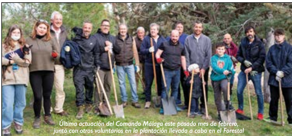
Última actuación del Comando Málaga este pasado mes de febrero, junto con otros voluntarios en la plantación llevada a cabo en el Forestal

Lo primero que hicimos fue ir a limpiar "la mina del Pasidre", limpiamos y desbrozamos el entorno, y, por supuesto, recogimos toda la basura y restos que sacamos para depositarlos en contenedores de basura. Esta primera actuación llamó mucho la atención en redes sociales ya que la inmensa mayoría de villaodonen-