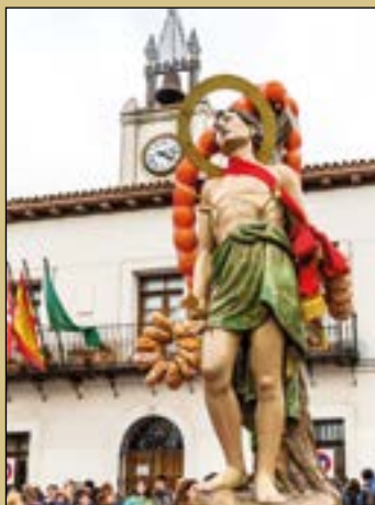
Fotografía de portada: