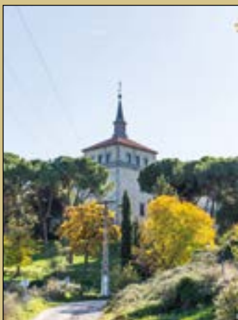
Fotografía de portada: Paseo de los Testerales Noviembre 2021 Ana Martín Padellano (Atención al tendido de media tensión que afea el paisaje)