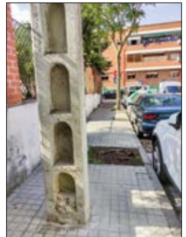
Obstáculos impiden el tránsito de peatones