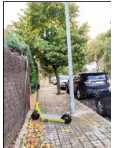
Patinetes eléctricos obstaculizando el paso