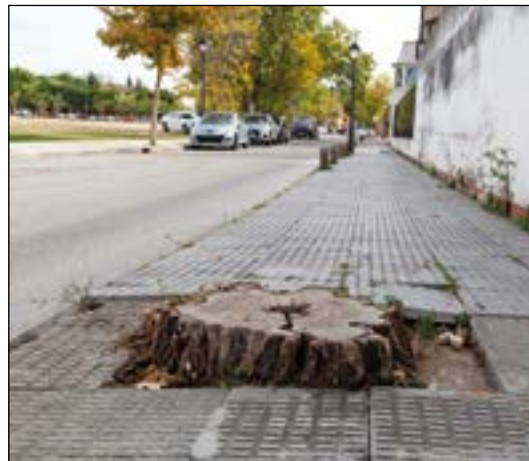
Tocones de árboles llevan años sin que nadie los arregle