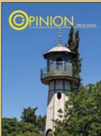
Fotografía de portada: "Mirador de Cacho" Julio 2021 Ana Martín Padellano