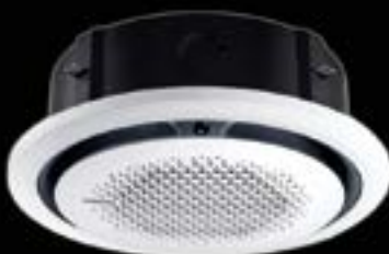
Exclusivo Cassette 360°