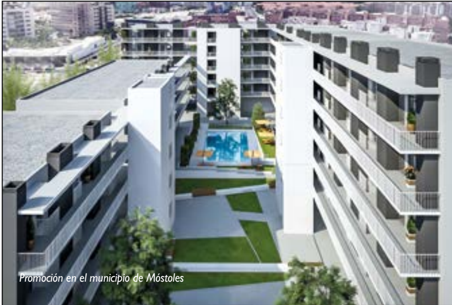
Promoción en el municipio de Móstoles