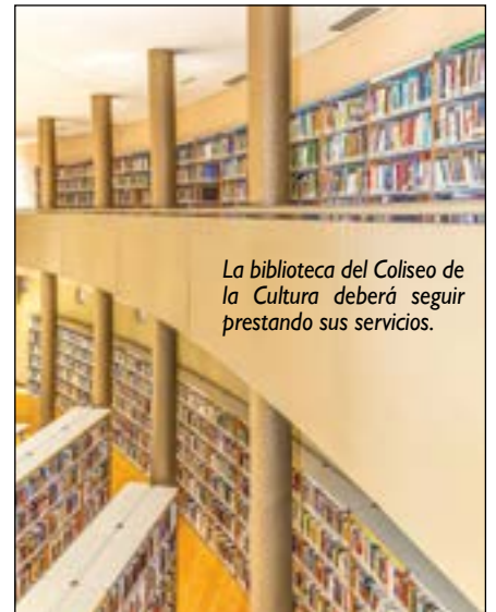
La biblioteca del Coliseo de la Cultura deberá seguir prestando sus servicios.