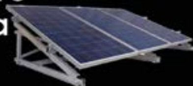
Generación Energía Eléctrica Solar