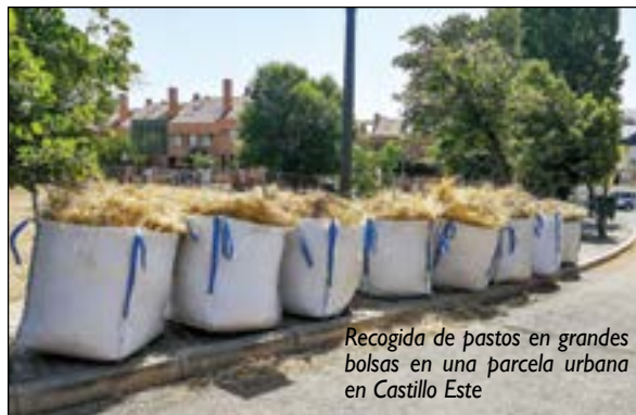
Recogida de pastos en grandes bolsas en una parcela urbana en Castillo Este