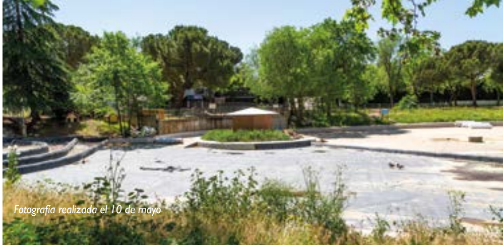
Fotografía realizada el 10 de mayo

Nos imaginamos que los patos y cisnes que habitaban en el estanque del Parque del Castillo estarán albergados en algún sitio que reúna las condiciones necesarias, ya que nuestro Ayuntamiento no ha informado, sobre todo, pensando en que una obra que iba a durar poco tiempo, parece ser que se va a convertir en el Oncológico II y todo por que el proyecto estaba mal realizado, y se dan cuenta cuando están a mitad del trabajo.