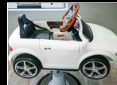
PELUQUERIA DE NIÑOS