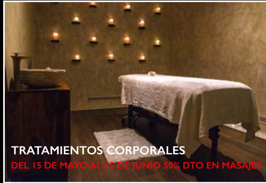
TRATAMIENTOS CORPORALES DEL 15 DE MAYO AL 15 DE JUNIO 50% DTO EN MASAJES

Todos los tratamientos se realizan con productos de las firmas • Kerestasse • Sweet Ácido Hialurónico • GHD