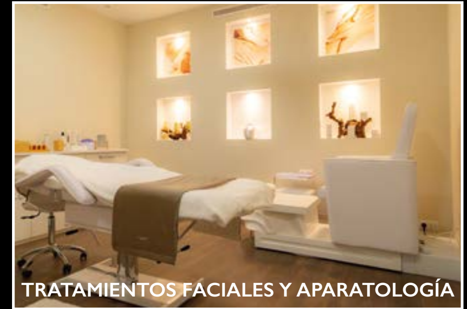
TRATAMIENTOS FACIALES Y APARATOLOGÍA

Contamos con las mejores marcas de aparatología como INDIBA y productos NATURA BISSÉ • PRESOTERAPIA • DEPILACIÓN: Laser Díodo, Cera tibia y caliente, con hilo • MANICURA Y PEDICURA: Esmaltes sin metales y orgánicos (Victoria Vynn) • EXTENSIONES DE PESTAÑAS: Natural volumen Ruso