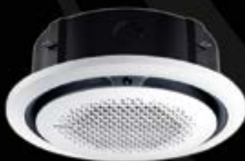
Exclusivo Cassette 360°