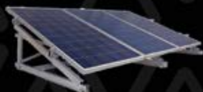
Generación Energía Electrica Solar