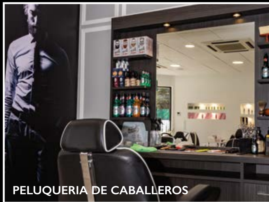
PELUQUERIA DE CABALLEROS