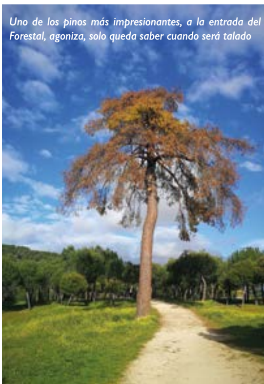
Uno de los pinos más impresionantes, a la entrada del Forestal, agoniza, solo queda saber cuando será talado

Por parte materna mis bisabuelos vivieron en una casa de monte, cerca de Sacedón, y de Sevilla la Nueva, con una vida muy dura, lo que les obligó a ir diseminando a parte de sus once hijos con familiares. Mi