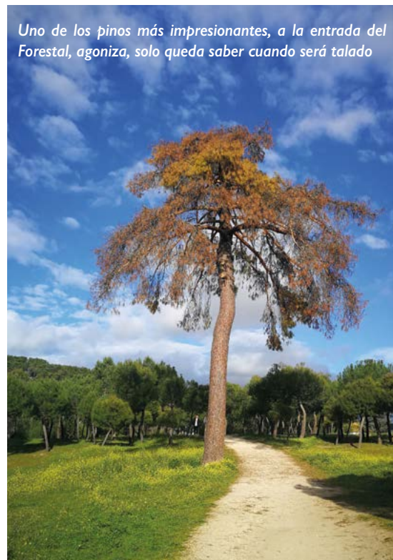
Uno de los pinos más impresionantes, a la entrada del Forestal, agoniza, solo queda saber cuando será talado

Conviene recordar que este arboreto es propiedad del Ayuntamiento y que es su responsabilidad procurar todos los medios para que no desaparezca. El Ayuntamiento somos todos y es por esto que el Ayuntamiento se debe implicar hasta las últimas consecuencias