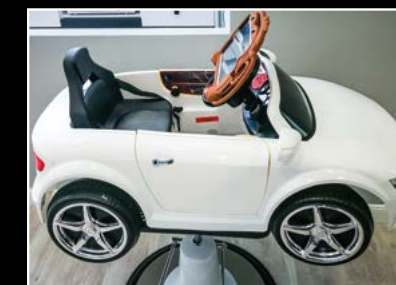
PELUQUERIA DE NIÑOS