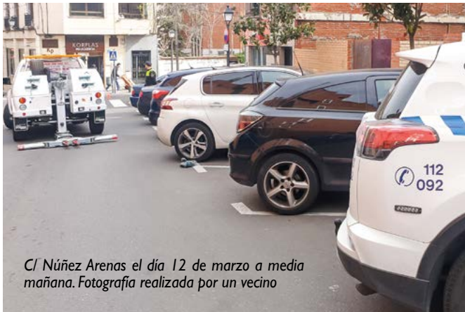
C/ Núñez Arenas el día 12 de marzo a media mañana.

Los vecinos no nos merecemos estas actuaciones de algunos policías, y mucho menos que los responsables políticos les amparen y encubran.