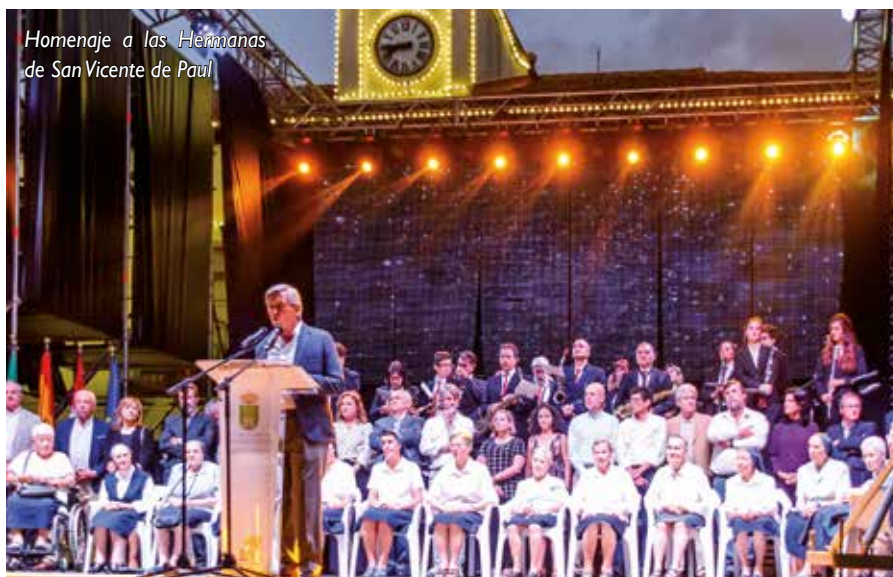
Homenaje a las Hermanas de San Vicente de Paul

Desde Círculo de Opinión ofrecemos a nuestros lectores un reportaje fotográfico, con la colaboración del gabinete de prensa del Ayuntamiento, en el que recogemos una parte de las actividades que hemos vivido durante nuestras Fiestas.