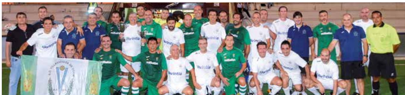
Peña Los Barbitúricos