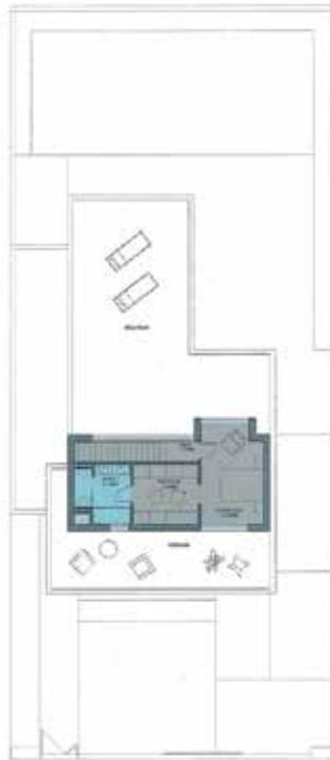
PLANTA ALTA Opción suite