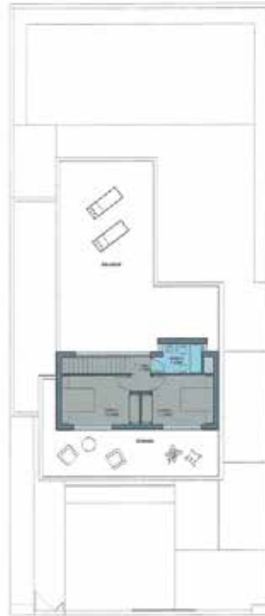
PLANTA ALTA Opción 2 dormitorios