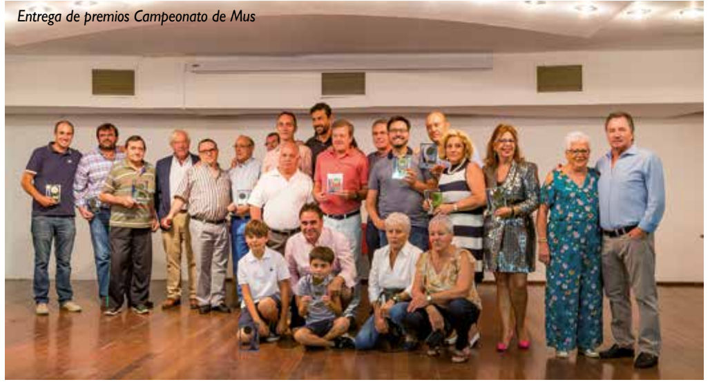
Entrega de premios Campeonato de Mus