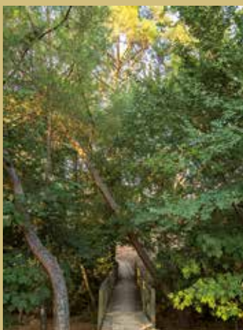
Fotografía de portada: "El Forestal". Octubre 2018 Ana Martín Padellano.