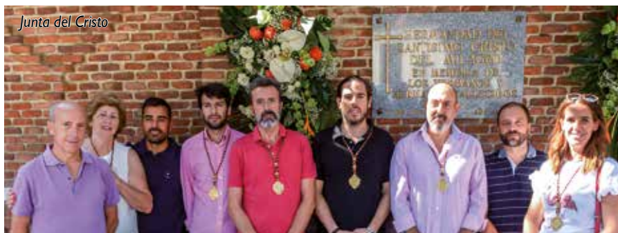
Junta del Cristo

ORTEGA - DE LA CALLE ABOGADOS - ASESORES