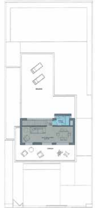
PLANTA ALTA Opción salón varios usos