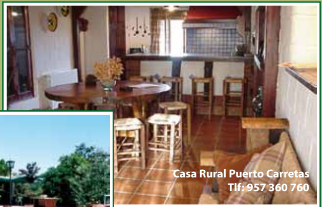
Casa Rural Puerto Carretas Tlf: 957 360 760