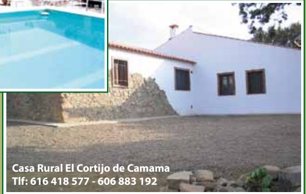
Casa Rural El Cortijo de Camama Tlf: 616 418 577 - 606 883 192