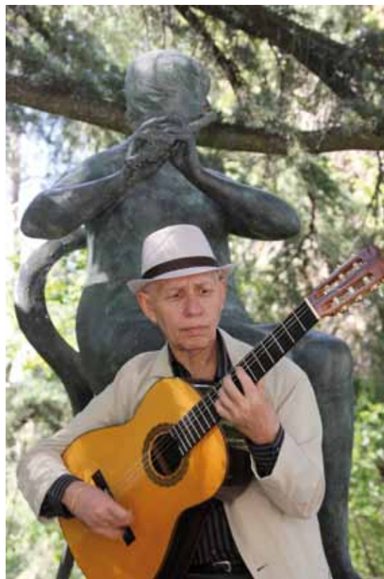
Textos Ana Higuera.

Además, hay que resaltar también el importante carácter solidario de esta obra, que busca dar difusión y visibilidad a la Fundación Uno entre cien mil, colaborando en