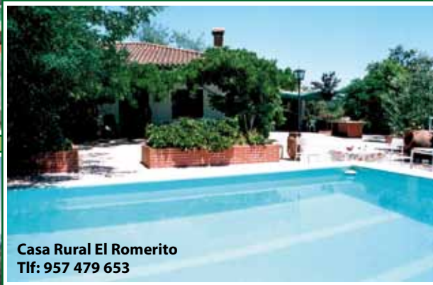
Casa Rural El Romerito Tlf: 957 479 653