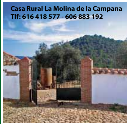
Casa Rural La Molina de la Campana Tlf: 616 418 577 - 606 883 192