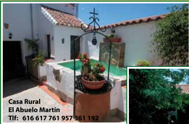
Casa Rural El Abuelo Martín Tlf: 616 617 761 957 361 192