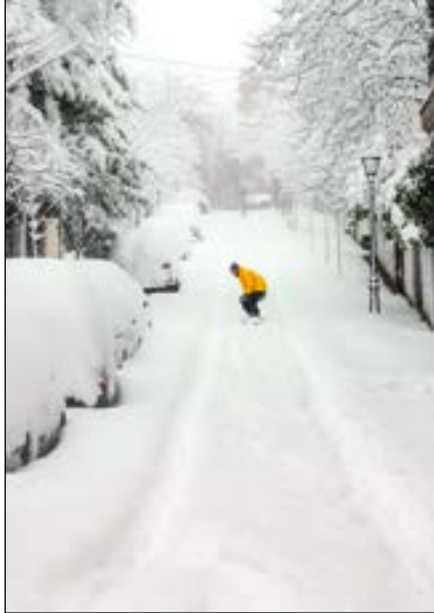
C/ López Polín