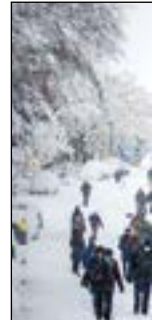
C/ Abrevadero - D