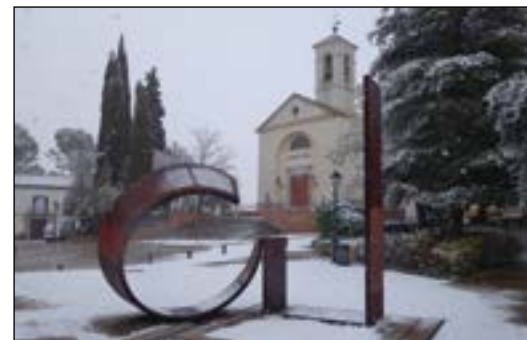
Iglesia Santiago Apóstol - Begoña Gómez