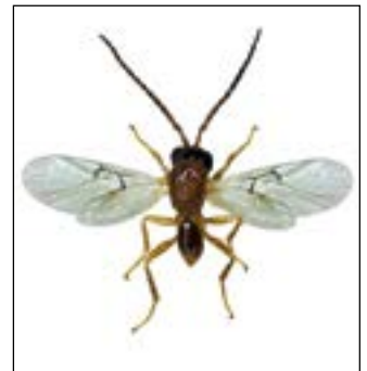
Biorhiza pallida , avispa de las agallas del roble.

ovoposidores (órgano alargado para depositar los huevos) mientras éstos se encuentran dentro de las agallas. Así pues, es de esperar que, del interior de las agallas con cinípidos parasitados, acaben emergiendo, mayoritariamente, los adultos de las avispas parasitoides. Actualmente, existen programas de liberación de parasitoides para controlar algunas plagas causadas por cinípidos. Por último existe también una gran diversidad de artrópodos que también viven dentro de las agallas; coleópteros, lepidópteros, dípteros, etc., estos generalmente se desarrollan una vez ya han emergido los cinípidos y actúan como inquilinos secundarios.