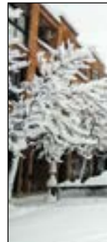
C/ Carretas - Mar