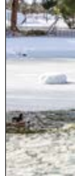
Parque de los Patos