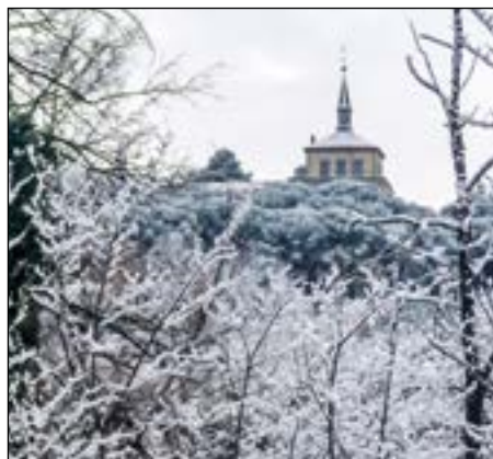
El Castillo desde el Forestal - Ana Martín Padellano