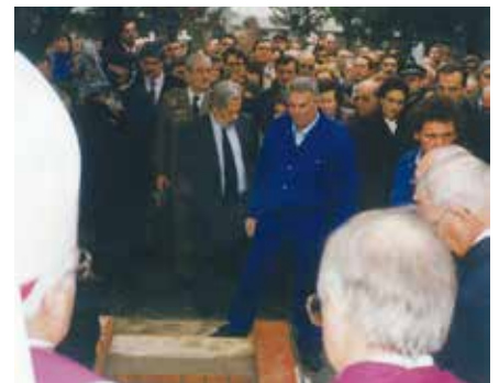
Momento del entierro de Gutiérrez Mellado. Diciembre de 1995.