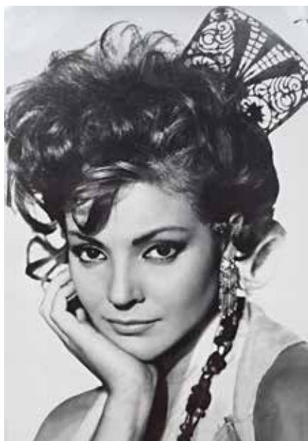
Carmen, en la plenitud de su belleza, cuando conquistaba a todos los públicos.

Pero aunque ella, Carmen Sevilla, la estrella más popular de España durante 50 años, ya no sepa quién es, millones de españoles no la olvidamos porque hemos crecido y hemos envejecido viendo sus películas, oyendo sus canciones o contagiados por su simpatía en sus programas de televisión. Ha sido amiga de todos los periodistas, jamás ha rehusado acudir a una cita cuando la llamaban para una obra benéfica y la sonrisa y