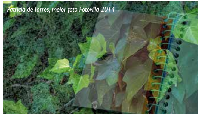
Patricia de Torres, mejor foto Fotovilla 2014

pa, 200 euros; Mejor fotografía, 150 euros; Segunda mejor fotografía, 75 euros; Mejor fotografía joven, 125 euros; Segunda mejor fotografía joven, 50 euros.