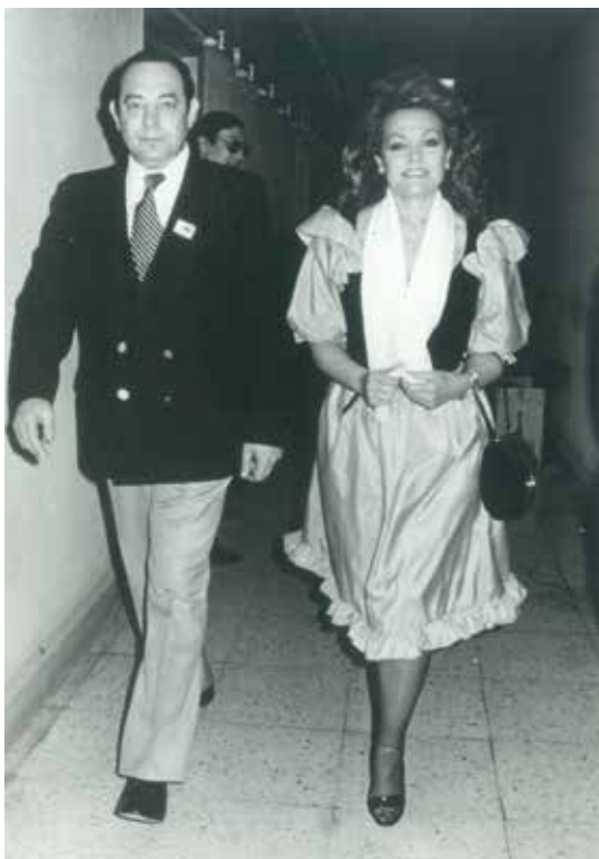
Carmen Sevilla, acompañada por nuestro colaborador Julián Navarro, en los estudios de Televisión Española en 1990.

ca Estrada, la joven y guapa azafata del programa de televisión "Un, dos, tres", que encantó al voluble compositor y la convirtió en su amante. Carmen Sevilla le había perdonado muchas veces, pero se plantó y solicitó la separación matrimonial. Cuando publicamos en Semana sus memorias me dijo: