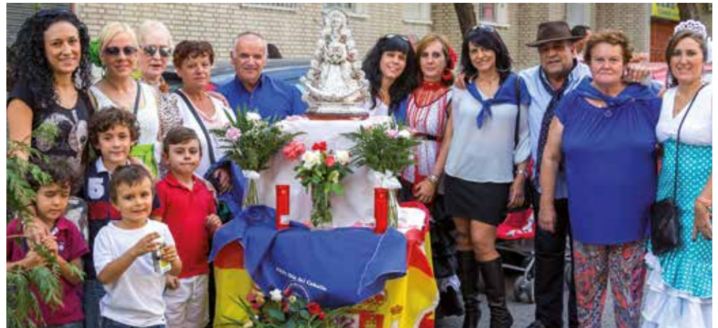
Grupo de vecinos el día del Caballo