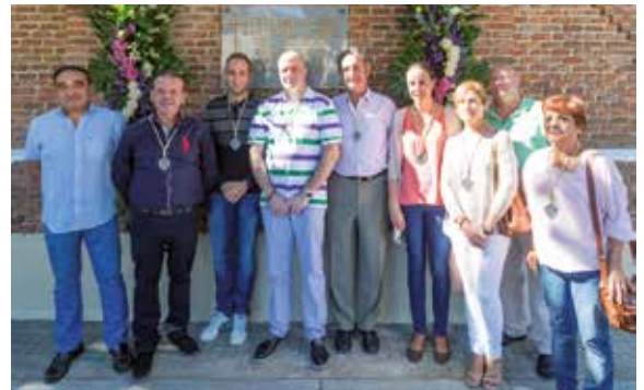
Junta del Cristo en la Ofrenda a los hermanos fallecidos