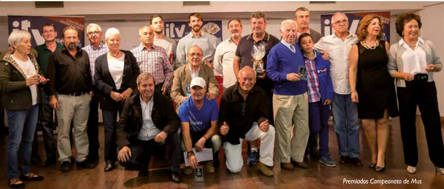
Premiados Campeonato de Mus