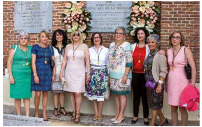
Junta de la Soledad en la ofrenda a las hermanas fallecidas

Desconocemos el precio que tendrán, por ejemplo, un tenor y una soprano cantando áreas de zarzuela a capela, eso sí, con un buen sonido para aquellos invitados que no tengan una buena audición.