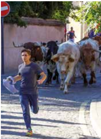
Momento del encierro del lunes