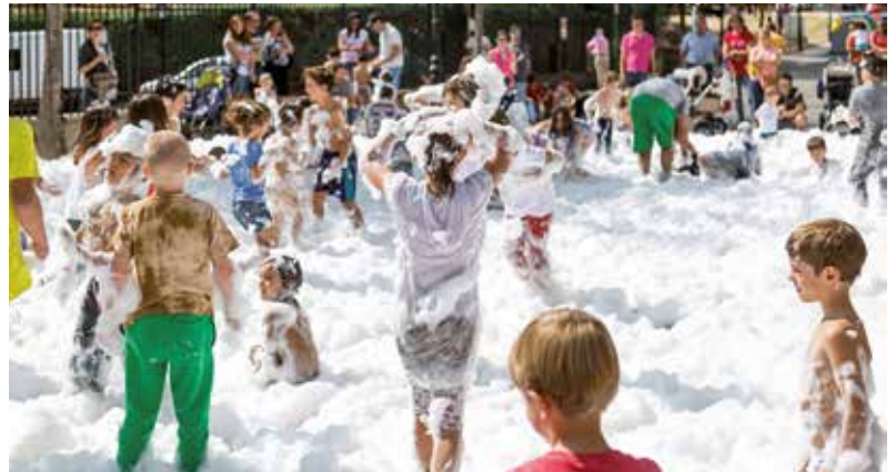
Fiesta de la espuma para los más jóvenes