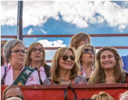
Presidencia de la corrida de la Soledad