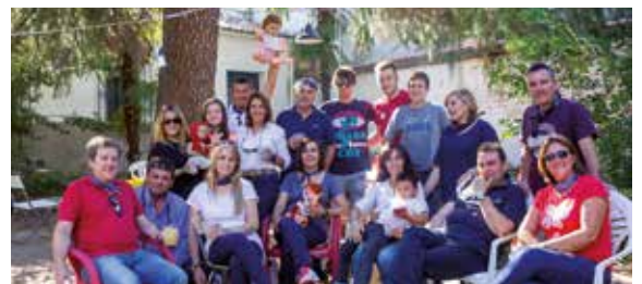
Grupo de amigos tomando el aperitivo