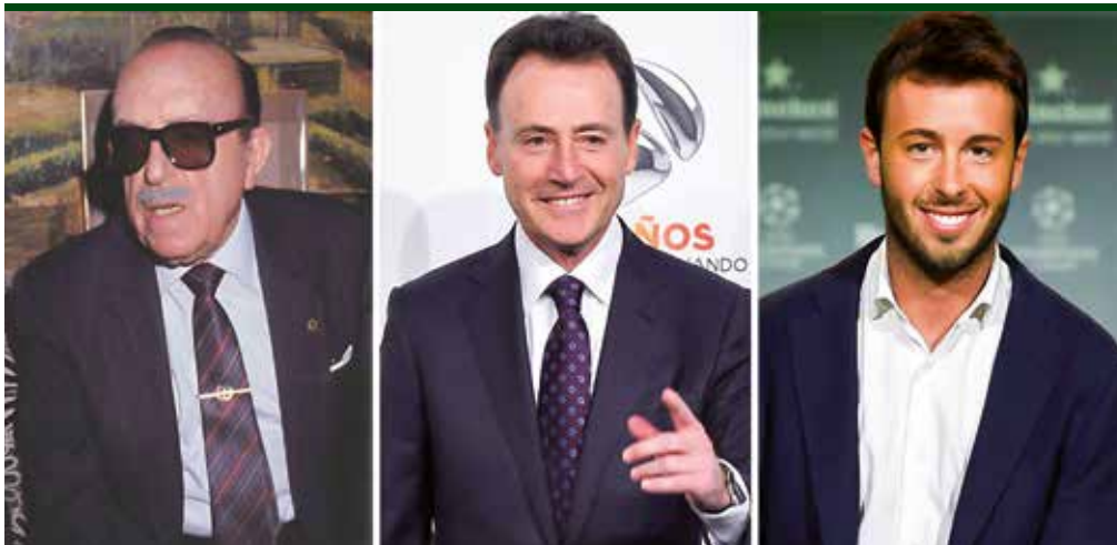
De izquierda a derecha, Matías Prats Cañete, Matías Prats Luque y Matías Prats Chacón, tres generaciones de excelentes comunicadores en radio y televisión.

La Hermandad del Stmo. Cristo del Milagro quiere manifestar su más sentido pésame por el triste fallecimiento de su hermano y acompaña en el dolor a todos sus familiares y amigos.