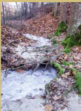
Fotografía de portada: