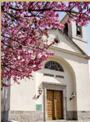
Fotografía de portada: "Iglesia Santiago Apóstol". Abril 2018 Ana Martín Padellano.