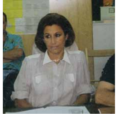
Fotografía archivo (papel), 1992 Salón de Plenos