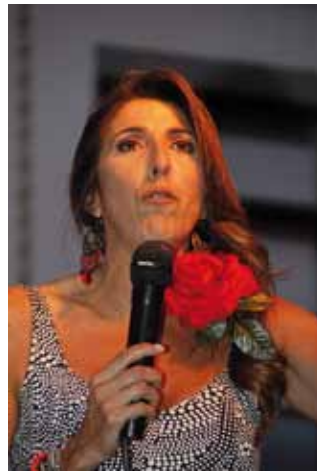
Paz Padilla, pregonera de la 2ª Feria de Andalucía