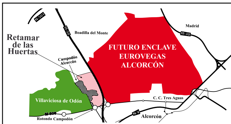
Plano de situación de Retamar de la Huerta, Campodón Alcorcón y Eurovegas respecto a Villaviciosa

Con los precios actuales de venta del metro cuadrado construido, y con los grandes gastos en las infraestructuras necesarias para una correcta planificación de la urbanización, hacen muy difícil, a nuestro juicio, la culminación de este nuevo barrio en un plazo corto de tiempo, pero nuestro Ayuntamiento deberá permanecer vigilante y muy atento, para que no tengamos que lamentarnos después. Siempre es mucho mejor prevenir que curar.