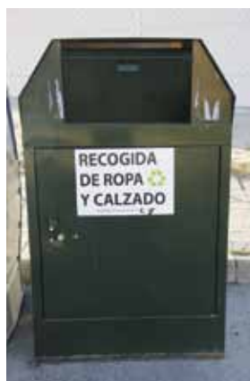
Contenedor anónimo e ilegal