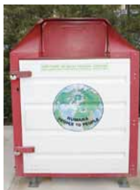
Contenedor de la ONG Humana, único legal