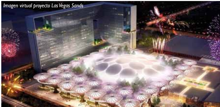
Imagen virtual proyecto Las Vegas Sands