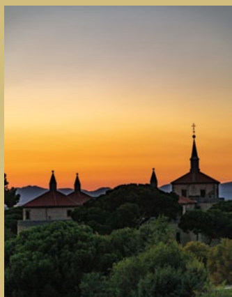
Fotografía de portada: