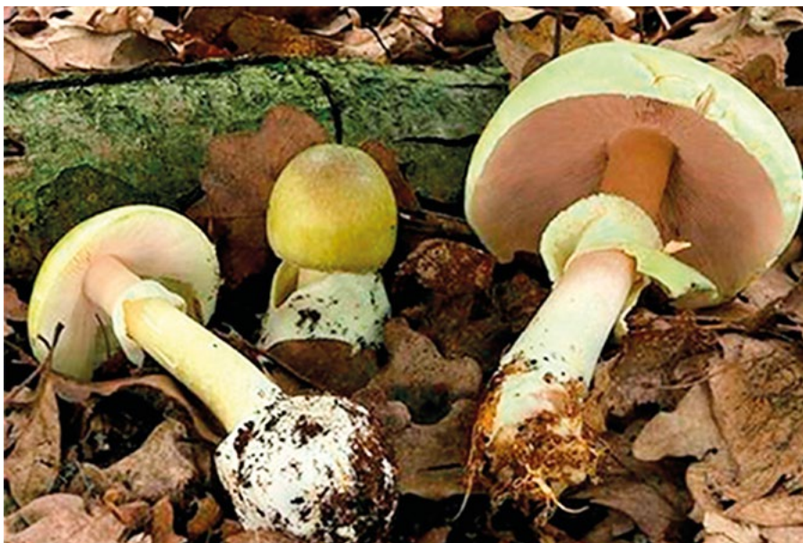
En la fotografía superior están mezcladas setas buenas y venenosas. ¿Cuál es buena? ¿Cuál es mala? ¿Son capaces de distinguirlas?

Y también es, cuando todos “los seteros”, animados por las diversas noticias que aparecen en los medios, se arman de sus diferentes herramientas y se lanzan a la captura de las codiciadas presas. Muchas veces con un ligero conocimiento de lo que van a bus-