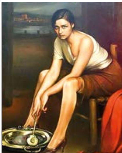
En el cuadro de Romero de Torres "La Chiquita Piconera" vemos a una joven removiendo un brasero con la badila.

un volcán o la chispa de un rayo. Lo que sí se descubrió fue la manera de provocarlo, bien frotando un palo con otro o bien chocando dos trozos de pedernal, la piedra con la que se "fabrica a b a n" cuchillos. El choque produce la chispa que prende en la h i e r b a seca y se p u e d e transportar de un lugar a otro y m a n t e n e r l o por tiempo indefinido sin que se apague. Así se aprendió a cocer el barro, realizar objetos de cerámica y a fundir metales. Se han encontrado cenizas en planchas de cobre o en vasijas de barro de hace cinco mil años y esta es la edad que puede tener el antecedente del brasero.