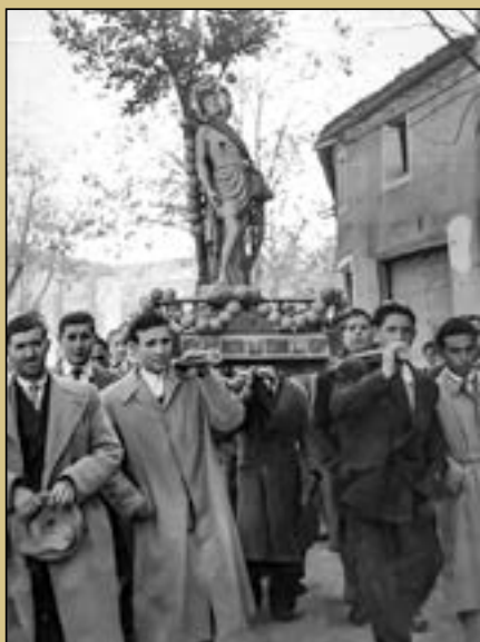
Fotografía de portada:

Procesión San Sebastián