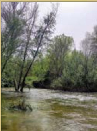
Fotografía de portada:

Río Guadarrama Abril 2024 Ana Martín Padellano