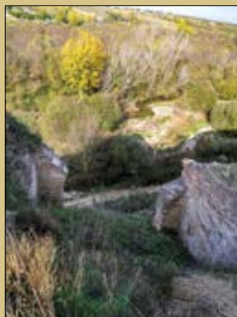
Fotografía de portada: