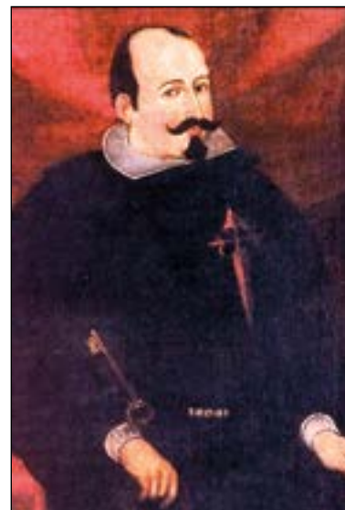
Luis Jerónimo Fernández, Conde de Chinchón

“Todo lo expuesto no representa solo una noticia de un suceso que se relaciona con nuestra villa [Villaviciosa de Odón]; representó una noticia histórica para toda Europa, por donde se