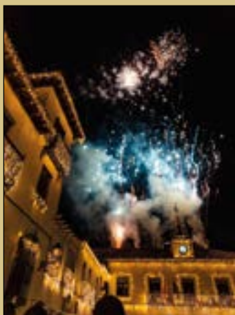
Fotografía de portada: Inaugación iluminación navideña 2023. Plaza de la Constitución Ana Martín Padellano