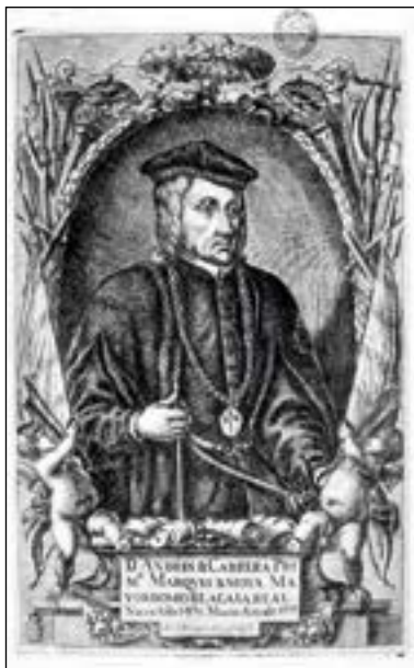
Andrés de Cabrera Marqués de Moya

Los Reyes [Católicos], con fecha 5 de julio de 1480, expidieron un Privilegio Real haciendo donación a los marqueses de Moya, Andrés Cabrera y a Beatriz de Bobadilla del sexmo de Valdemoro. Quedaron, para los Moya, la villa de Chinchón, del sexmo de Casarrubios ... [cita los lugares que pasaron a pertenecer a los Moya entre ellos:] Odón actual Villaviciosa de Odón que entonces contaba con 88 vecinos.