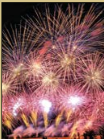
Fotografía de portada: Polvora 2022 Ana Martín Padellano