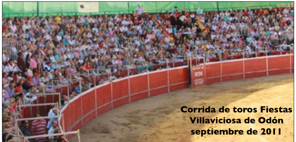
Corrida de toros Fiestas Villaviciosa de Odón septiembre de 2011

La Hdad. del Stmo. Cristo del Milagro quiere manifestar su más sentido pésame por el triste fallecimiento de su hermana y acompaña en el dolor a todos sus familiares y amigos.