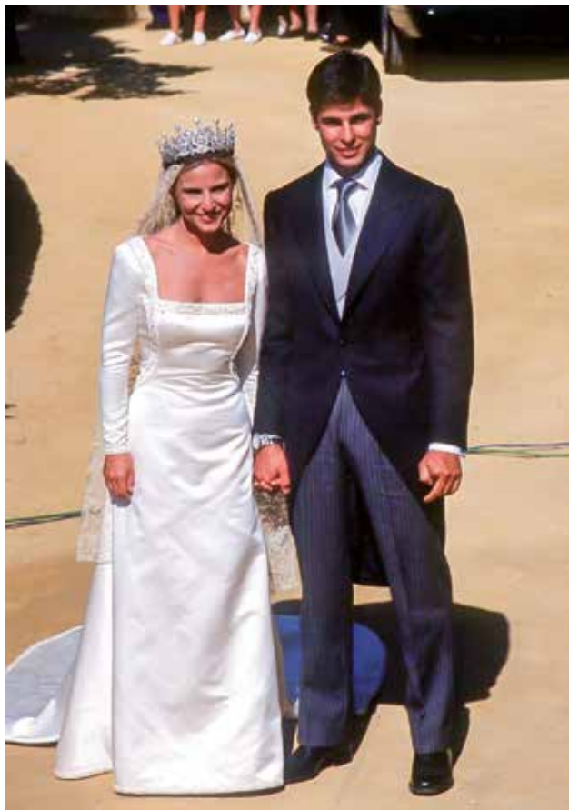
Eugenia Martínez de Irujo y Fran Rivera el 23 de octubre de 1998, día de su boda

Por eso, cuando se conoció que Francisco Rivera y Eugenia eran novios, Cayetana revivió el romance que treinta años atrás soñó con ella de protagonista. Igual que con el abuelo, con el nieto se deshizo