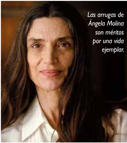
Las arrugas de Ángela Molina son méritos por una vida ejemplar.

toográfica. Más de cien obras sostienen su fama.