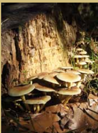
Fotografía de portada: