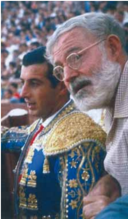
Ordóñez y el premio Nobel Ernest Hemingway durante una corrida del "verano sangriento" de 1959.

con sus caballos el mayoral y un joven ayudante. Venían a buscarme.