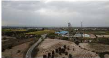
Carretera Villaviciosa-Móstoles M-856

La ineptitud del PP impide solucionar un punto negro que amenaza a nuestros vecinos. Sólo quién no vive en el pueblo o tiene coche oficial se puede permitir el lujo de ignorarlo.