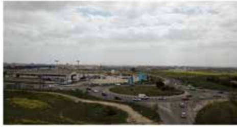
Glorieta de Campodón

El colapso de los gobernantes no debe significar el colapso de nuestras comunicaciones. Debemos instar a una solución que de fluidez a la zona.