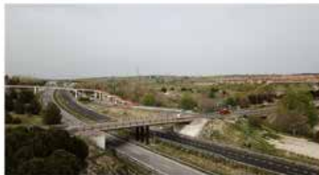
Puente Arroyo de la Vega

Una oferta de más de 400 viviendas con alquiler a largo plazo, derecho a compra, vivienda libre o en régimen de cooperativa. Que ningún joven tenga que irse del municipio.