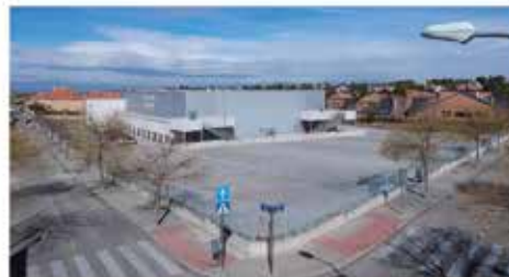
Pabellón de Judo en Campodón

Ayudar a nuestro tejido empresarial para favorecer a los comercios locales. Crear un Vivero de Empresas para fomentar el talento y empleo.