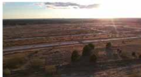
Barrio de El Monte de la Villa

Más de 20.000 vehículos diarios sortean los continuos atascos derivados de una nula capacidad de gestión de las vías de comunicación que unen nuestro municipio.