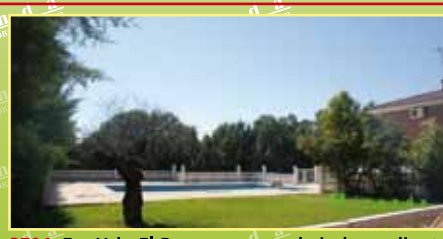
3704: En Urb. El Bosque, venta de independiente en una planta 296 m 2 , 1547 m 2 de parcela, hall, abierto, cocina office, salón, 4 hab., 2 wc, 1 aseo, porche, sala de juegos, trastero, garaje para 2 coches. Precio a consultar.