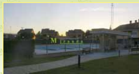
3603: Oportunidad. En Urb. Campodón, venta de piso, bajo con zonas comunes de 83 m 2 , 65 m 2 de patio, hall, cocina, salón, 2 hab., 2 wc, 2 pza. garaje. 280.000 €.