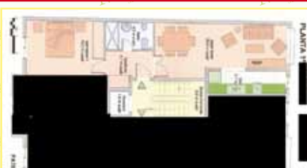
3597: Obra nueva. Casco urbano, piso, céntrico- 53 m 2 Hall- salón- cocina- 1 habitaciones- wc.- Ascensor- trastero- precio: 145.000 €. Más información en nuestras oficinas.