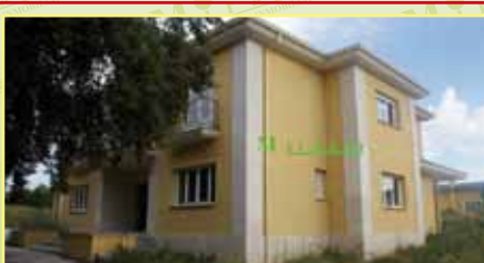
3678: Oportunidad. En Urb. El Bosque obra nueva venta de independiente 500 m 2 1927 m 2 de parcela, hall a doble altura, cocina office 25 m 2 , salón 40 m 2 , 3 hab., 3 wc, aseo, 134 m 2 diáfanos. 650.000 €.