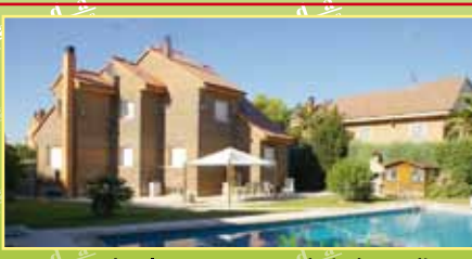
3741: En Urb. El Bosque venta de independiente de 442 m 2 , 1169 m 2 de parcela, hall abierto, cocina office, salón, 6 hab., 3 wc, 1 aseo, porche, bodega, sala de juegos, trastero, garaje para 2 coches. 750.000 €.