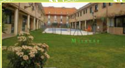
3640: Casco urbano venta de adosado de 130 m 2 . Con zonas comunes, hall, cocina, aseo, salón con salida a un patio de unos 25 m 2 aprox, 3 Hab. y 2 baños y garaje. 350.000