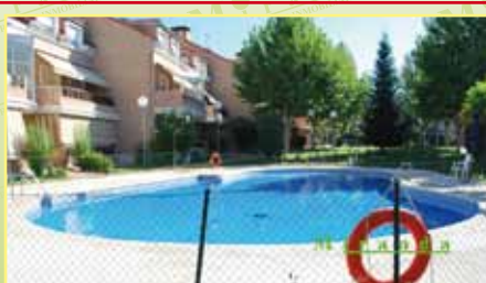
3733: Casco urbano, apartamento bajo, El Guijarral de 55 m 2 con terraza, zonas comunes, hall, salón, cocina, hab., wc., garaje. 210.000 €.