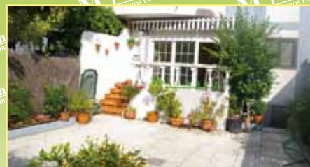
3677: En casco urbano, venta adosado de 180 m 2 y 170 m 2 de parcela, zonas comunes, hall, cocina, aseo, salón, 5 hab., 2 wc, aseo, buhardilla, trastero, garaje. 345.000 €.