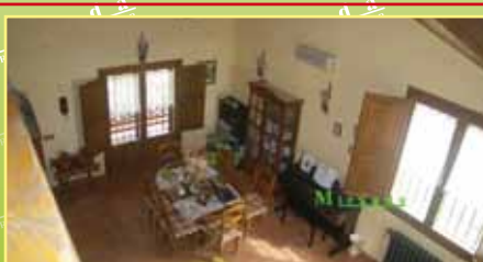
3746: Urb. El Bosque, venta de independiente estilo rustico, 309 m 2 , 1428 m 2 de parcela, hall, cocina office, salón, 5 hab., 3 wc, 1 aseo, porche, biblioteca, trastero, garaje para 2 coches. 750.000 €.