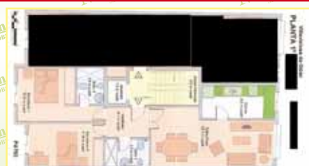
3600: Obra nueva. Casco urbano, piso, céntrico, 73 m 2 , hall, salón, cocina, 2 hab., 2 wc., Ascensor, trastero, 195.000 €. Más información en nuestras oficinas.