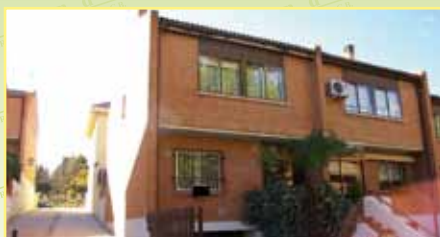
2909: En casco urbano venta de adosado de 156m 2 y 100 m 2 de parcela urb. cerrada con zonas comunes, hall, cocina, salón, 4 hab. y 2 baños, garaje, trastero. 360.000 €.