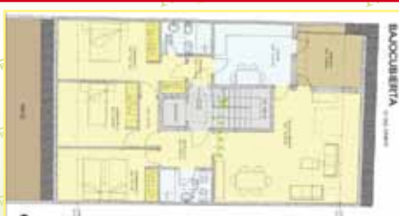
3610: Obra nueva. Casco urbano, piso ático, céntrico, 105 m 2 , con terraza, hall, salón, cocina, 3 hab., 2 wc., ascensor, trastero. 295.000 €. Más información nuestras oficinas.