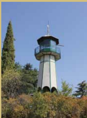
Fotografía de portada: