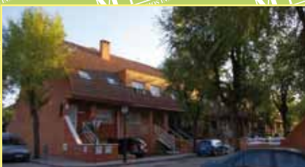
2656: Casco urbano, venta de chalet adosado de 200 m 2 constr., 50 m 2 de parcela, hall, cocina, salón con chimenea, 1 aseo, 3 hab., 2 baños, habitación, garaje 2 coches, trastero. 400.000 €.