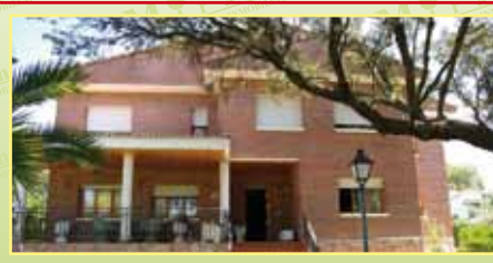
2849: Oportunidad. En Urb. El Bosque venta de independiente 300 m 2 , 1500 m 2 de parcela tenis, amplio hall, cocina office, salón chimenea abierto, 5 hab., 3wc, 2 aseos, porche, bodega, trastero garaje para 2 coches, 560.000 €.