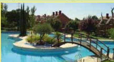
3616: En Urb. El Bosque, venta de adosado de 150 m 2 y 115 m 2 de parcela con zonas comunes, hall, cocina, salón, patio, 3 hab., y 2 aseos, buhardilla, garaje. 440.000 €.