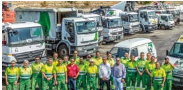
Plantilla y maquinaria de URBASER en la campaña municipal de Quitapesares el 22 de septiembre de 2017,

Este sistema también permite una mayor rapidez en las operaciones, lo que reduce el ruido durante la recogida, minimizando las molestias para los vecinos.