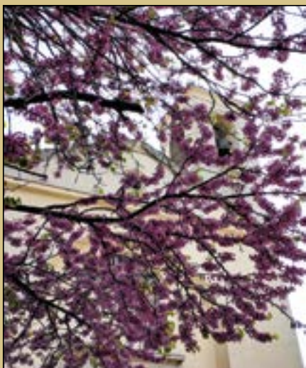
Fotografía de portada: Santiago Apóstol abril 2026 Ana Martín Padellano