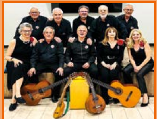
GRUPO LOCAL CANASDECANTAR

Sería deseable que los asistentes respetasen al máximo ese maravilloso entorno natural. ●