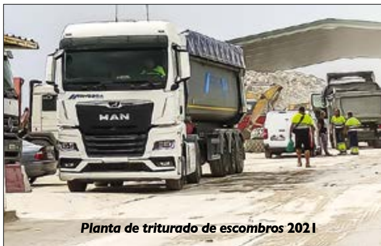
Planta de triturado de escombros 2021

Esta planta de tratamiento de residuos tóxicos está previsto que entre en funcionamiento en 2026. Para la construcción de esta planta se tendrá que levantar una nueva instalación "consistente en losa de hormigón y nave de almacenamiento, con sus acometidas, instalaciones y accesos correspondientes". La empresa que lidera este tremendo y negativo proyecto para Villaviciosa de Odón es la misma que lleva varios años destrozándonos los pulmones con la planta de triturado de escombros, la multinacional francesa Derichebourg, y nos está perjudicando gravemente a los villaodonenses ●