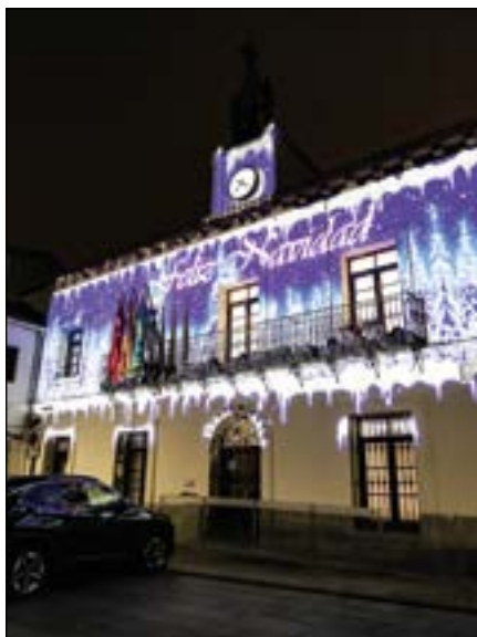
Fotografía de portada: Ayuntamiento iluminado por Navidad (2025)