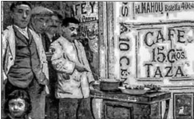
La muy antigua calle del Príncipe remata por el este con la plaza de Santa Ana y en su número 27 (antes nº33) vino a instalarse Casa de Alvarez, que en el año 1924 era la más añeja de las cervecerías de Madrid, donde hicieron famosos sus pajaritos fritos

Miles de ejemplos hay que confirman este bárbaro dicho popular: "Bicho que corre y pájaro que vuela, a la cazuela" ●