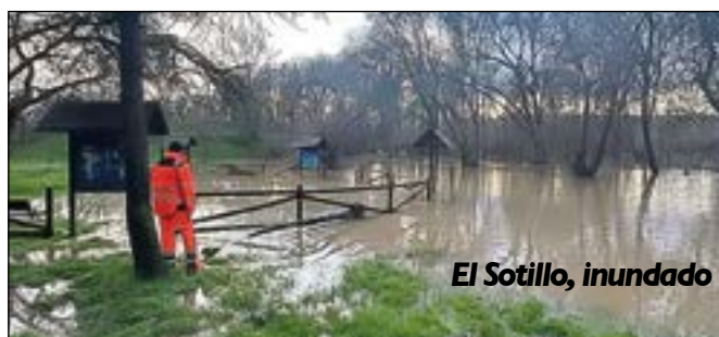
El Sotillo, inundado