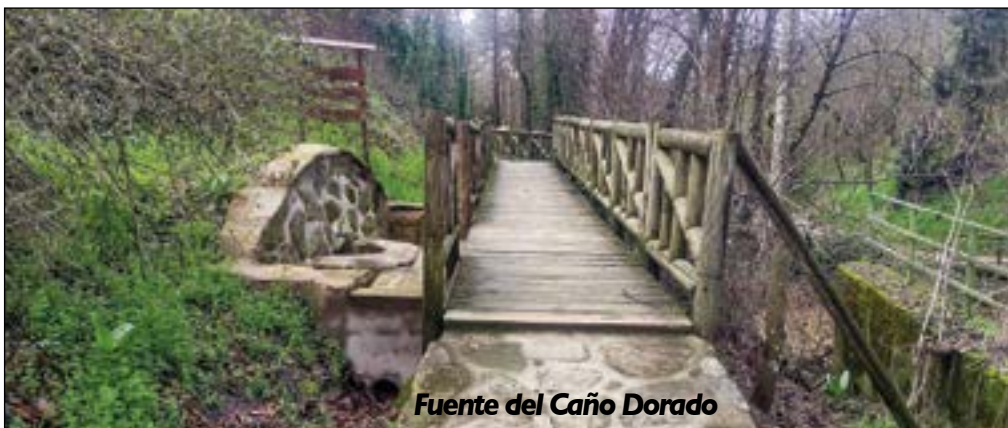
Fuente del Caño Dorado