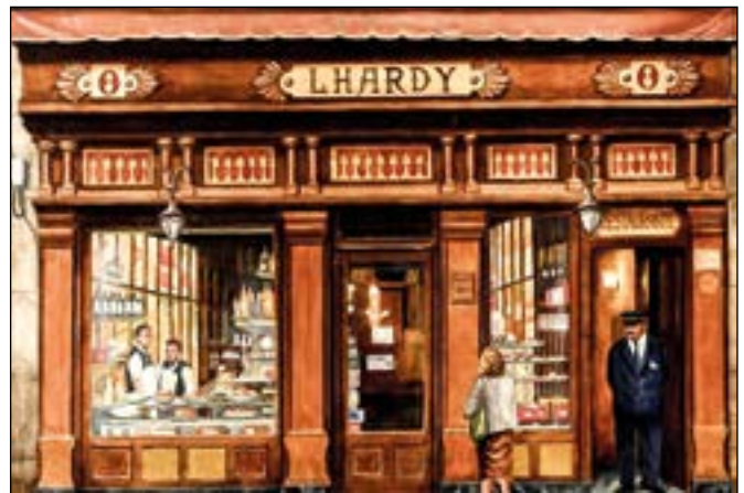
El famoso restaurante Lhardy entra en su tercer siglo de existencia en la misma casa de la Carrera de San Jerónimo donde abriera sus puertas en 1839, cuando Madrid era Corte de la Reina Gobernadora y acabada de estrecharse el abrazo de Vergara, entre Espartero y Maroto.

Merece especial atención el consumo de ancas de rana, que se servían en bares y restaurantes. Aunque pueden cocinarse de muchas maneras, la más común es al ajillo, como las gambas. Dicen los gour-