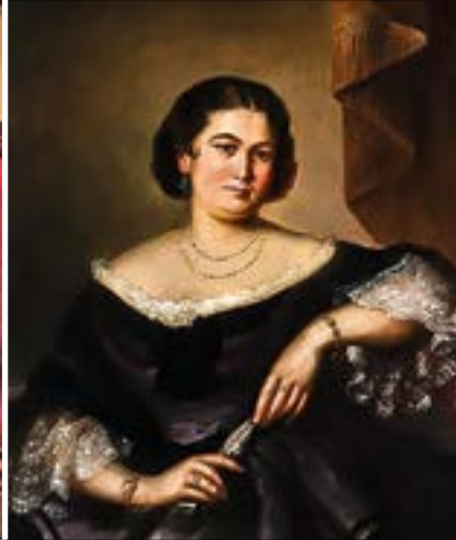
Retratos de Mariano José de Larra y Dolores Armijo, protagonistas de una trágica historia de amor.

de los "amores contrariados" como decía García Márquez, traemos aquí la figura de Mariano José de Larra, un personaje con la fuerza de un ciclón quien antes de cumplir 28 años ya era famoso y admirado como escritor y como político, aunque solamente fuese diputado veinte días.