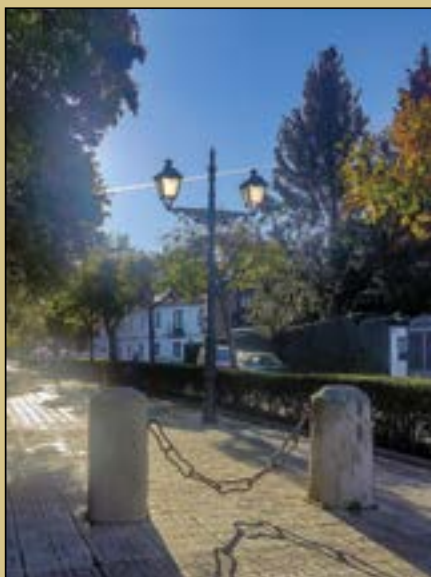
Fotografía de portada:

Paseo López Puigcerver Febrero 2025