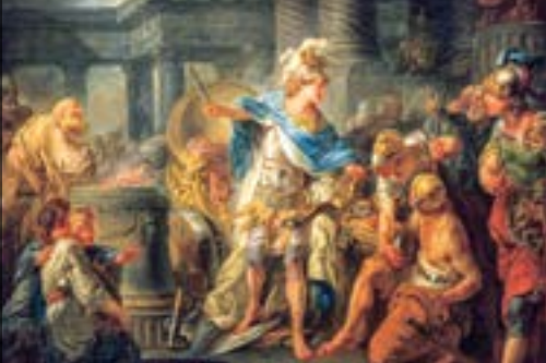
Cuadro en el que Alejandro Magno se enfrentó en Frigia al reto del Nudo Gordiano

"Cortar el nudo gordiano" o "cortar por lo sano" significa resolver tajantemente y sin contemplaciones un problema. aunque lo de Cortar por lo sano fuera la expresión que se utilizó en la edad media para amputar un miembro por la parte sana para evitar la gangrena o la necrosis avanzada ●